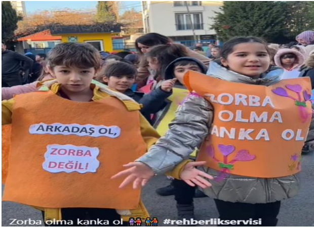
Zorba olma kanka ol #rehberlikservisi

Okulumuzda öğrencilerin daha olumlu akran ilişkileri geliştirebilmesi için akran zorbalığını önleme çalışmaları kapsamında sizlerle ortak bir proje yürütmek istiyoruz.